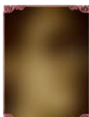
Luka Comeryótel sasophon